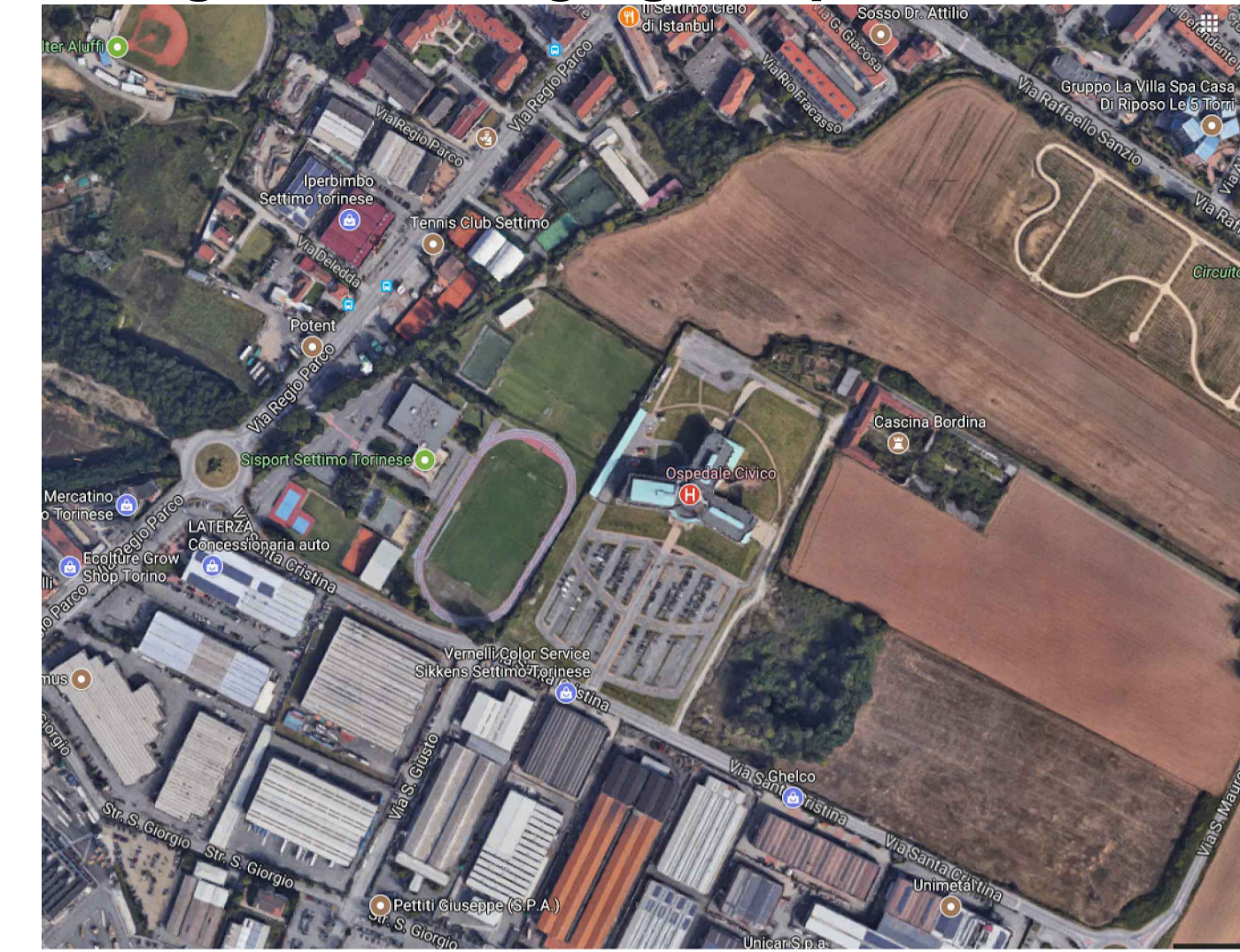
Immagine aerea da google maps